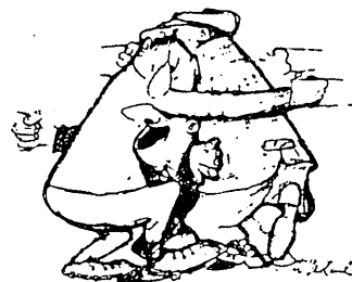
"Look out everybody—I'm on instruments"