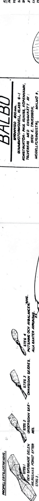
FIG. 4 KROK OCH MED PROPELLER.

KROPPEN: BRÖG EXAKT LEKA KROPPSIDOR DIREKT PÅ RITNINGEN. HÄLL LINGLISTERNA PÅ PLATS OCH VER RITNINGEN MED KNAPPNÄLAR. KROPPSSIDORNA SAMMANSETTES MED HJÄLP AV TYKALISTER OCH SMYTTET K.S. BÖDA MED TYKALISTERNA MÄRKTA X OCH SMYTTET OMBELÄGRT HÄRLEFTER FASTLÄMNAS. LÄMNINGSTÄLLET (FIG. 1) INNAN DE DIVRIGA TYKALISTERNA ANBRINGAS. SPÄNNTEN K6, K7, K8 UTSKÄRS OCH LÄMNAS PÅ PLATS. HÄR-EFTER FASTLÄMNAS TYK 2x3 mm LISTER I SMÅ-RINGSPPANNAR. ALLT PUTSAS NOGRANT. STABILISATORN BRÖGS DIREKT PÅ RITNINGEN. FE-MORNA UTSKÄRS OCH FASTLÄMNAS PÅ STABILISATORN.