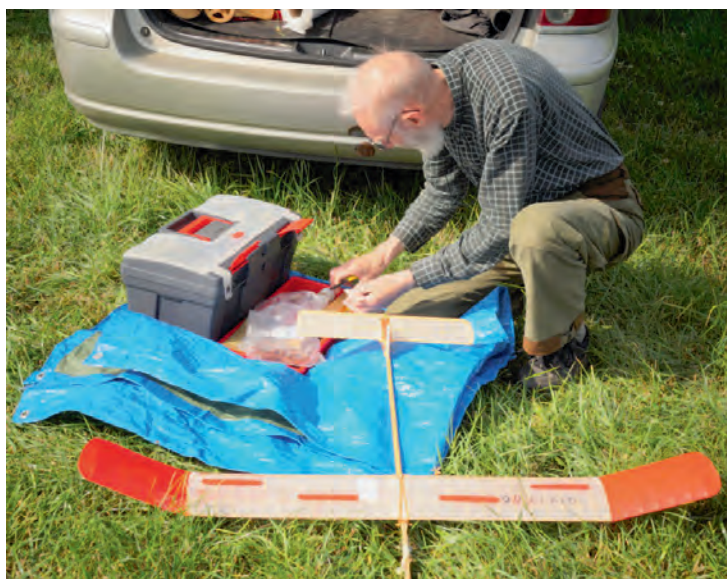
Frede siger farvel til sin Qivitog

Værre gik det min Qivitog, som dummede sig, eller var det mig, i sin første start med sølle 14 sek. til følge, for så i anden start at flyve max. Desværre landede den i en ærtemark 800 m borte og selvom jeg havde signal fra den på min tracker, måtte jeg efter godt 3 timers søgning på kryds og tværs gennem korn og ærtemarker give op træt, sulten og tørstig. Den 9. september fik jeg så en mail fra den svenske formand, der havde fundet modellen næsten uskadt, men nok får lov at overvintre i det svenske indtil næste sommer.